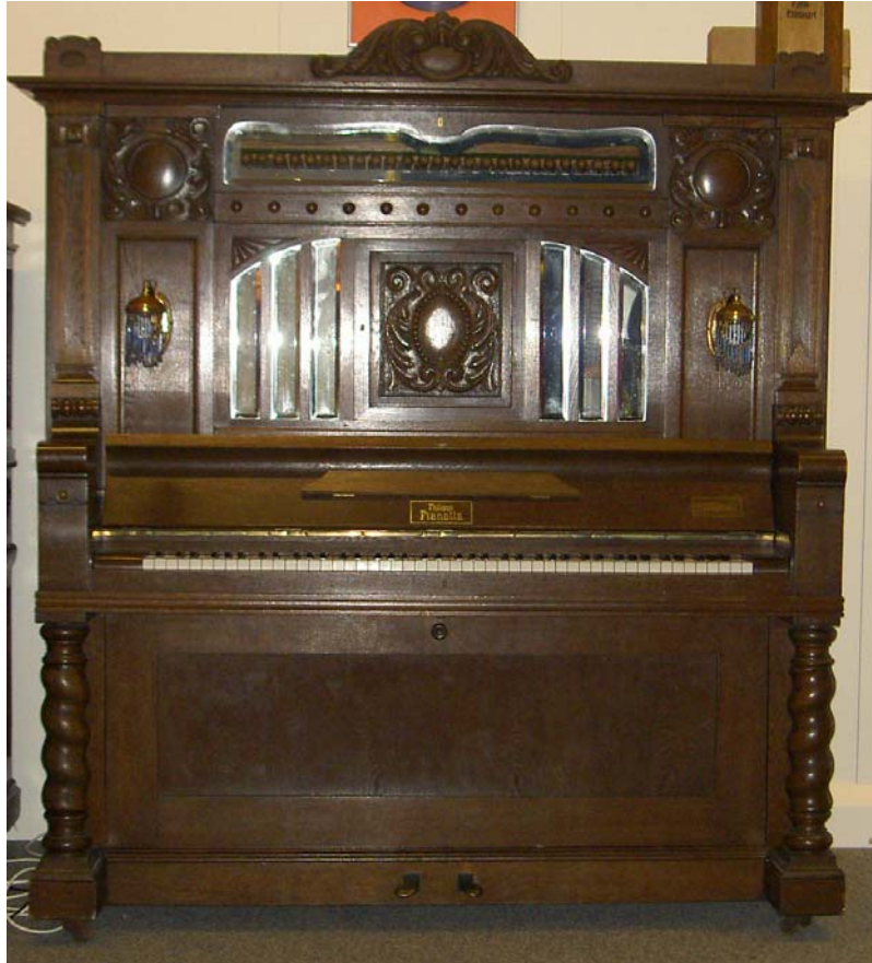
Das restaurierte Orchestrion