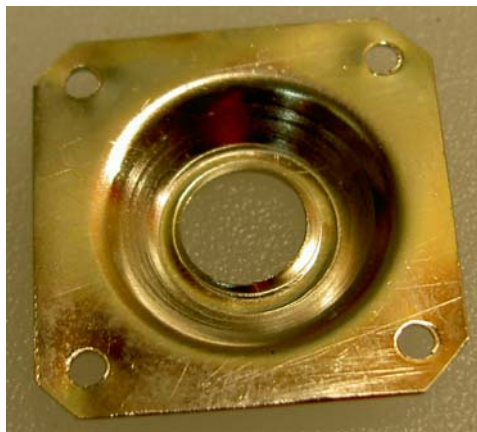
Manchmal müssen auch sehr aufwändig herzustellende Metallteile neu gefertigt werden

Dieses Orchesterion wurde von der Firma Philipps in Frankfurt am Main gebaut. Es enthält neben einem Klavier mit Mandolineneffekt auch ein Xylophon mit 30 Tönen.