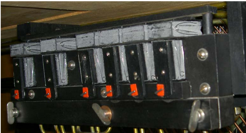
Der restaurierte Registerschaltapparat