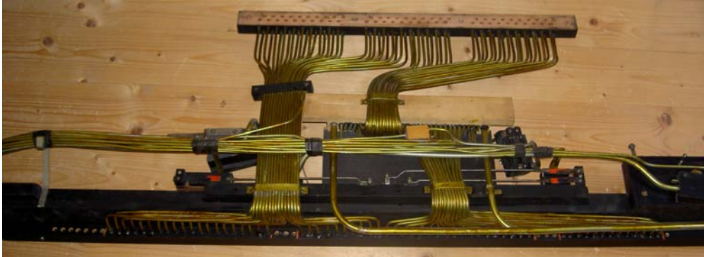
Die sehr schön ausgeführte Verrohrung des Obereinbaus