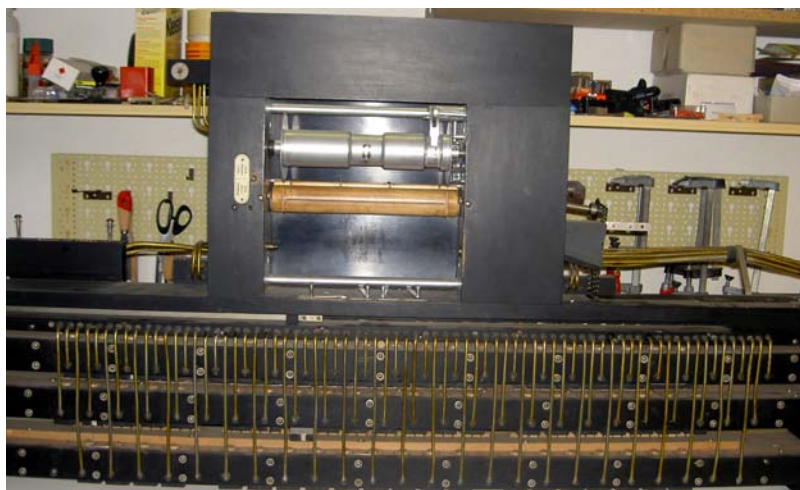
Der Obereinbau in unrestauriertem Zustand