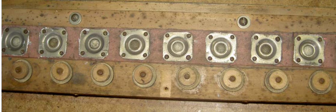
Die Vorventile des Xylophons vor der Restaurierung