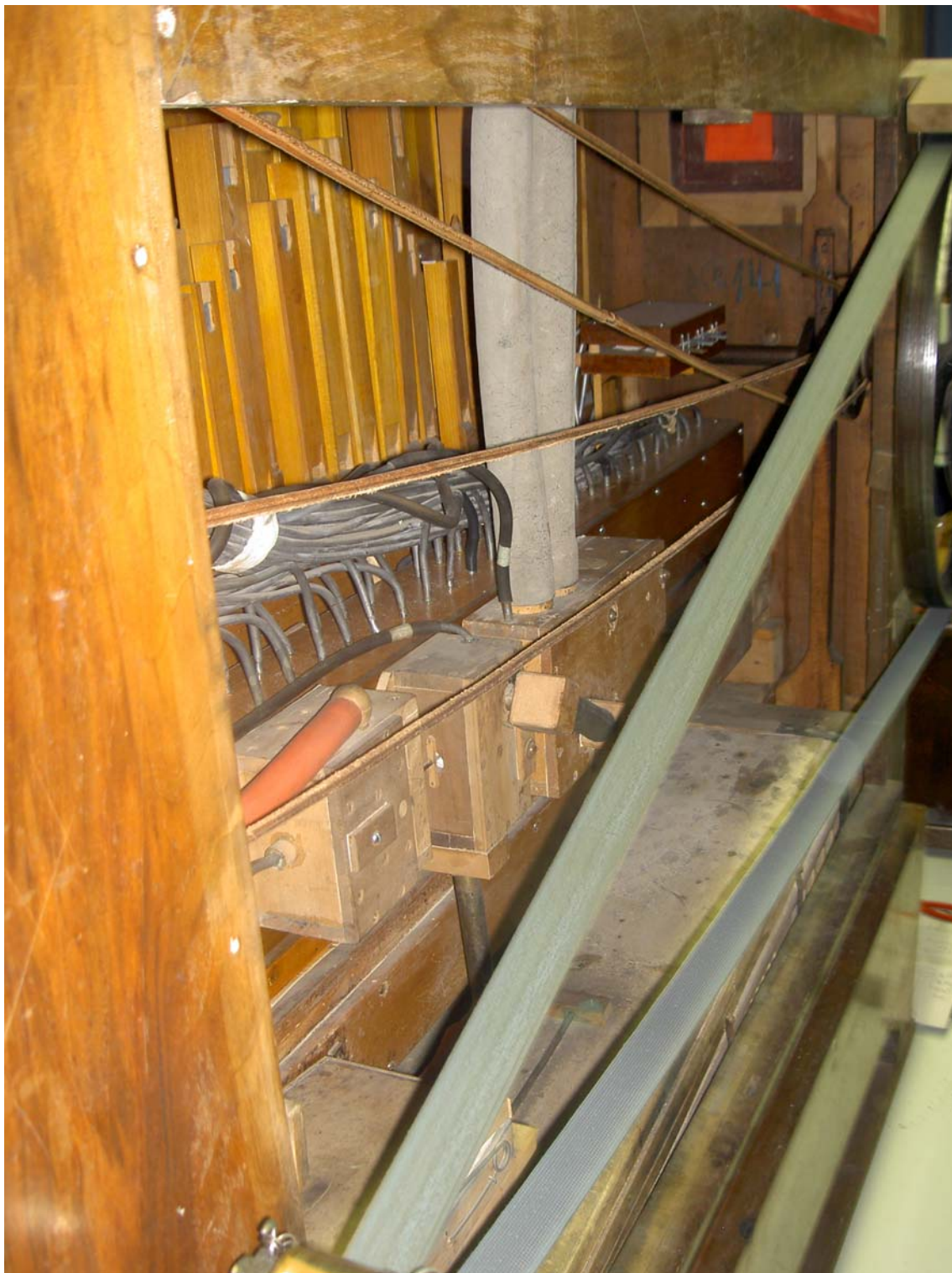
Blick in das Orgelwerk vor der Restaurierung