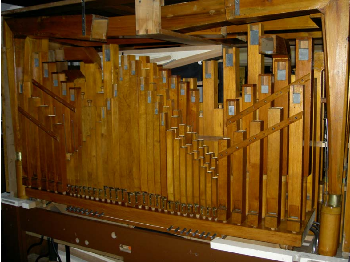
Blick auf das restaurierte Pfeifenwerk

Diese Karussellorgel wurde im Jahre 1908 durch eine der Waldkircher Filialen der Pariser Firmen Gavioli oder Limonaire als Modell 265 mit 68 Claves gebaut. Damals dienten Faltkartonnoten als Toninformationsträger. Zu Ende der 1920er Jahre wurde sie durch die Firma Gebr. Bruder aus Waldkirch auf Papiernotenrollensystem umgebaut (Modell 109 mit 66 Claves).