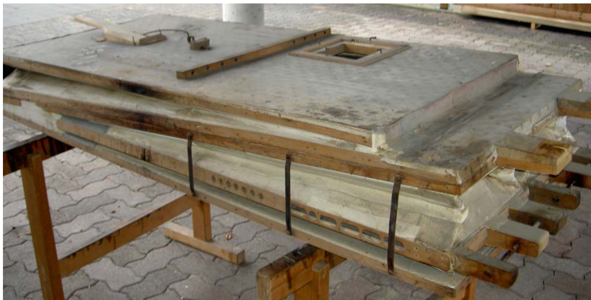
Der Blasebalg vor-